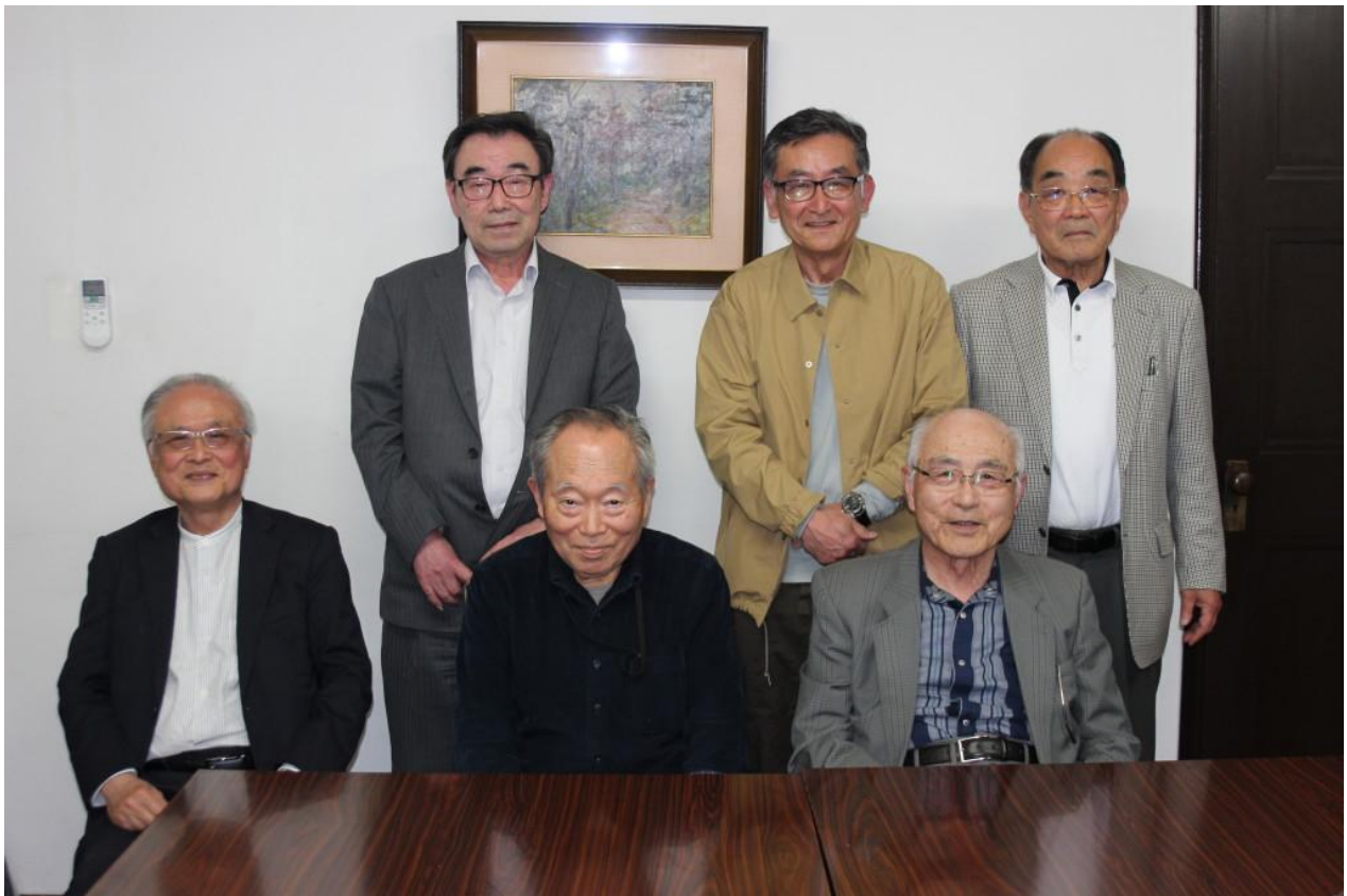
令和7年5月9日開催の月例会