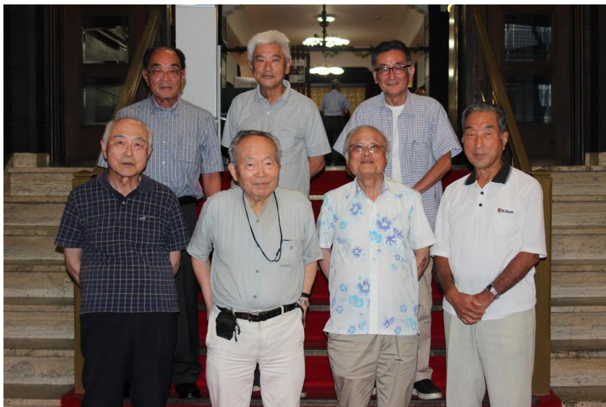
令和7年7月4日開催の月例会