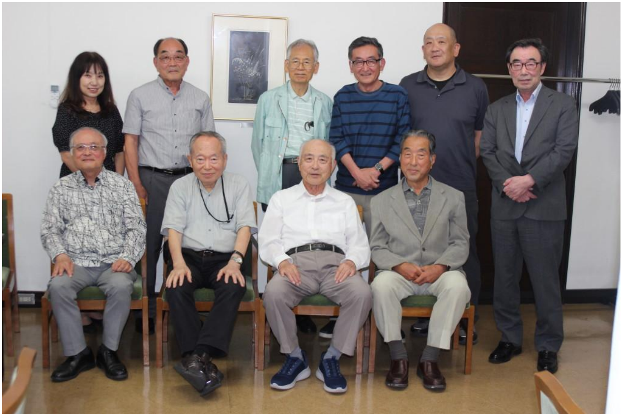
令和7年6月13日開催の月例会【第500回目】