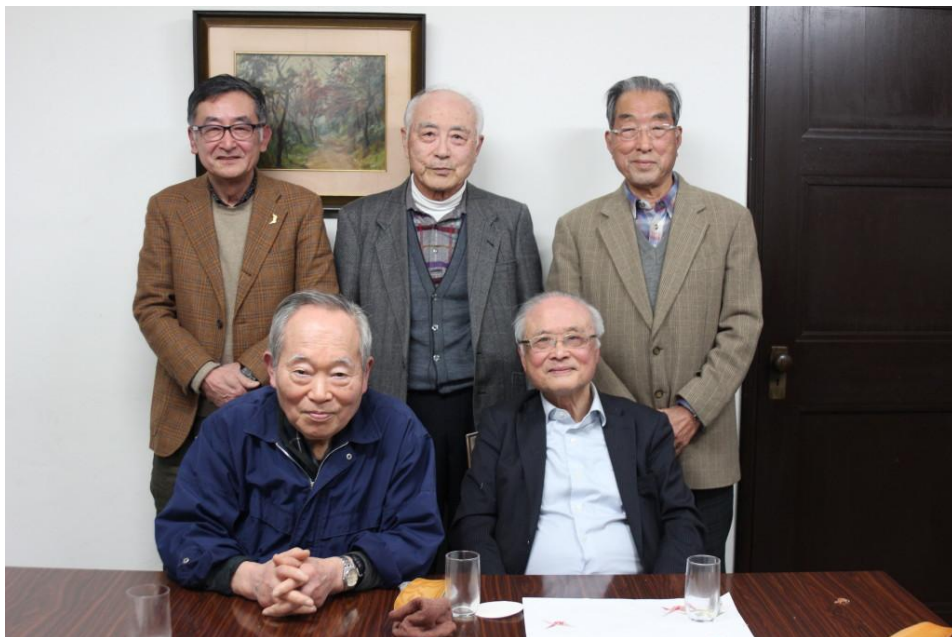
令和8年2月13日開催の月例会