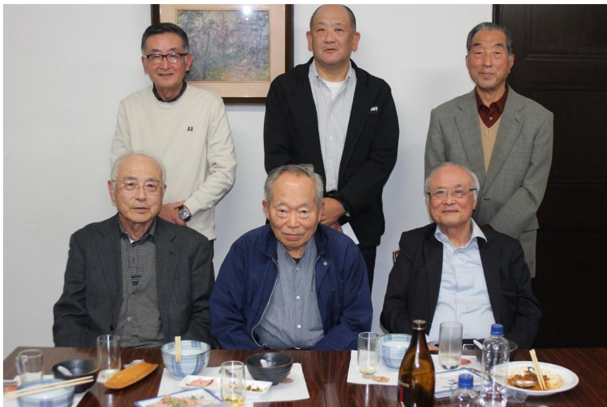
令和7年11月14日開催の月例会