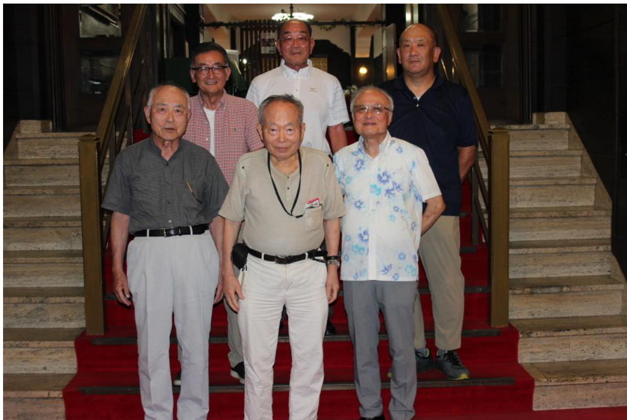
令和7年8月1日開催の月例会