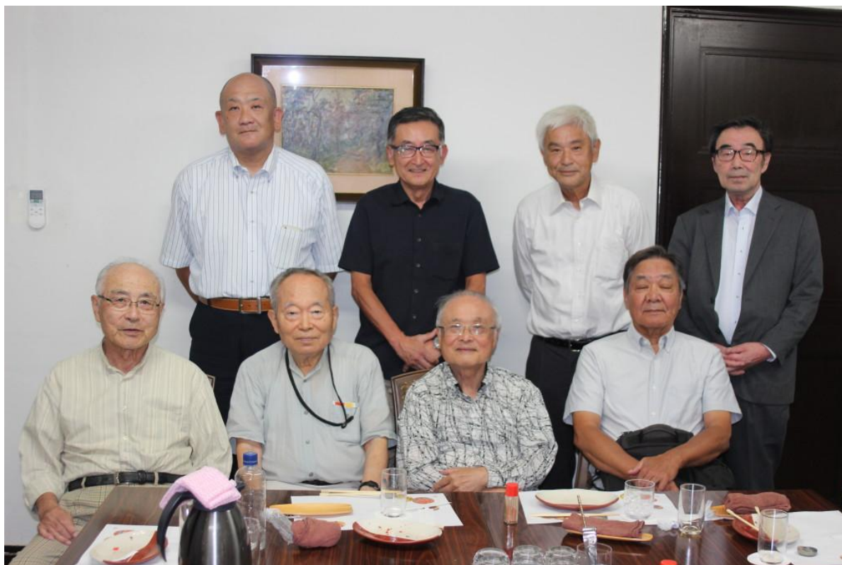
令和7年10月17日開催の月例会