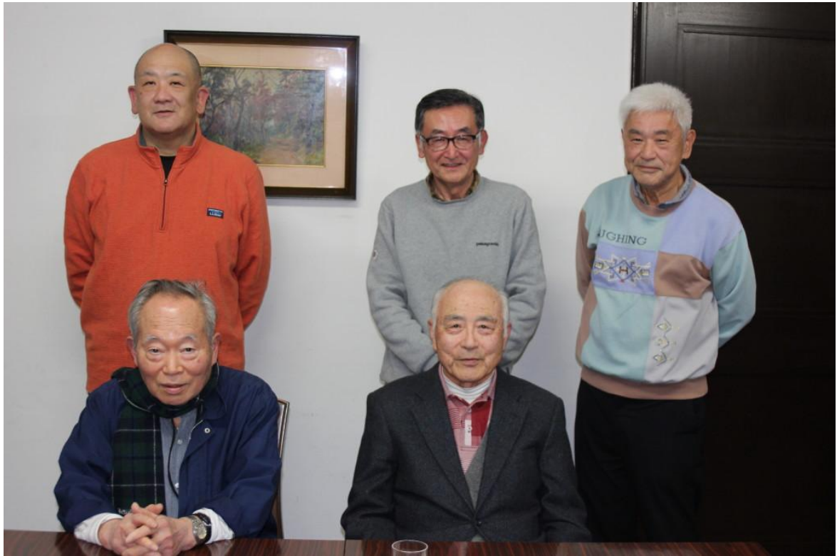
令和8年1月9日開催の月例会