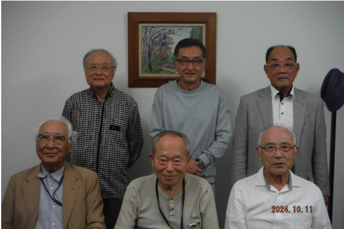
令和6年10月11日開催の月例会