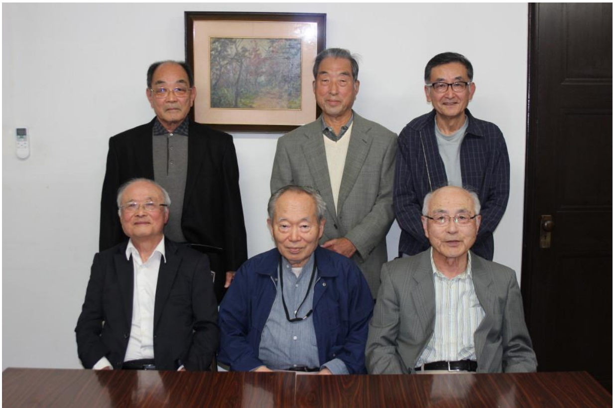
令和6年11月15日開催の月例会