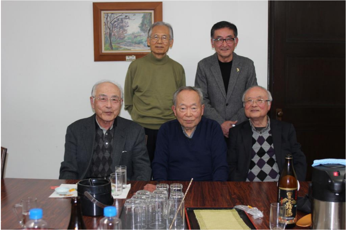
令和6年12月6日開催の月例会