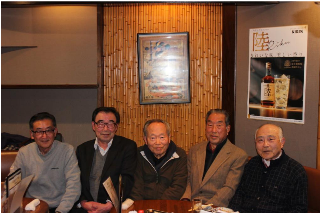
令和7年1月10日開催の月例会