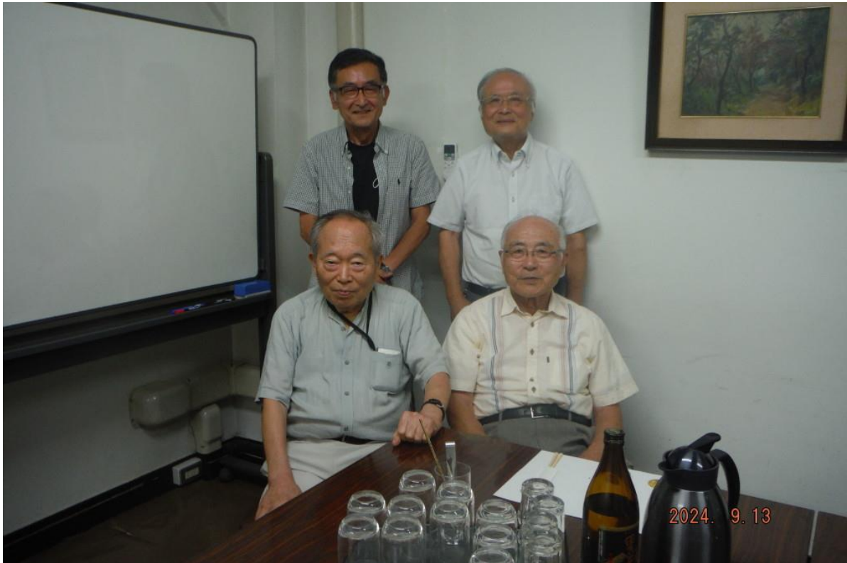
令和6年9月13日開催の月例会 (※8月は中止)