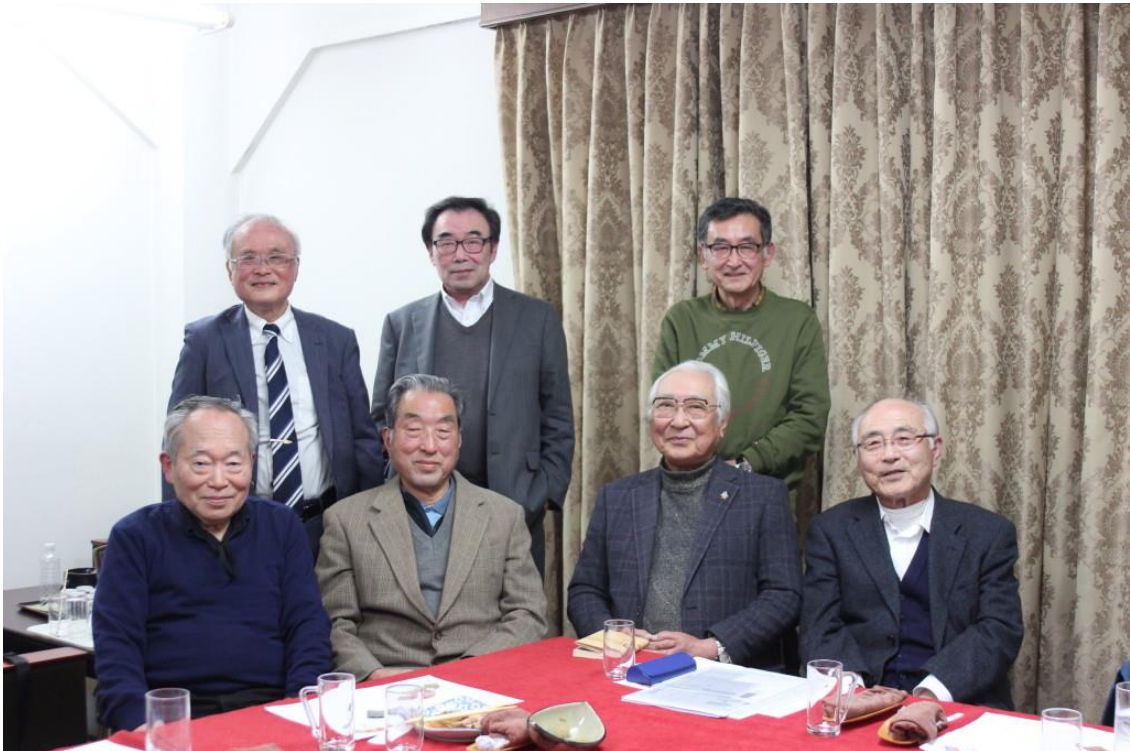
令和6年3月8日開催の月例会