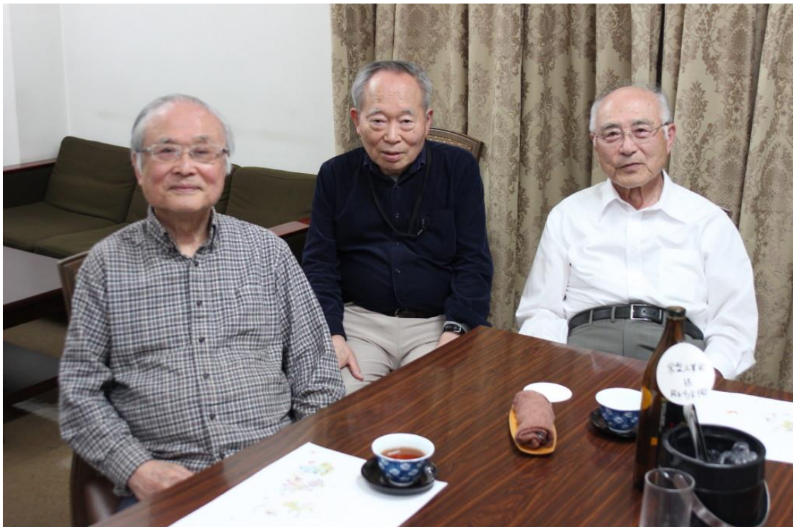
令和6年5月10日開催の月例会