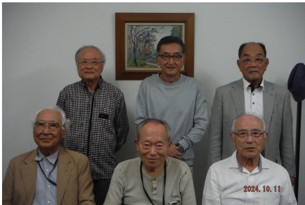
令和6年10月11日開催の月例会