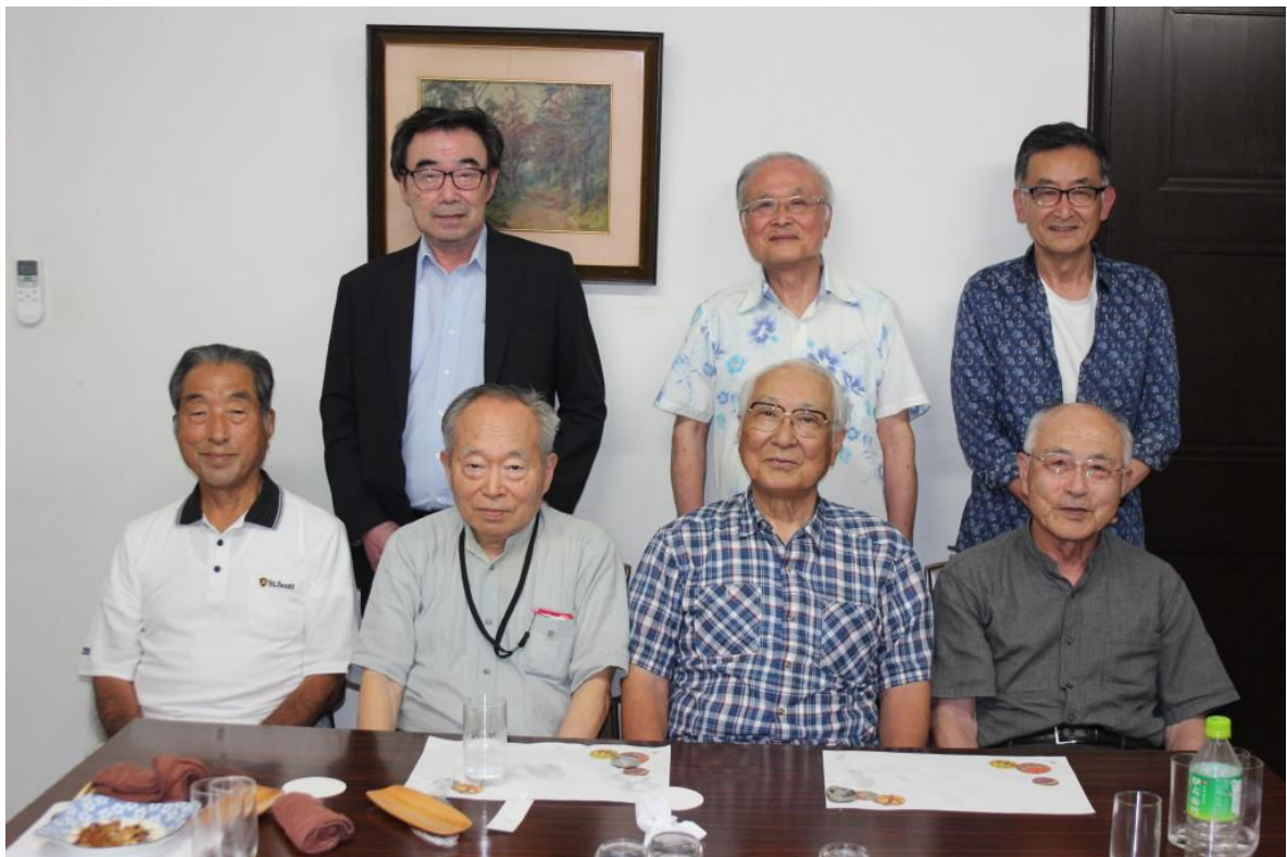
令和6年7月5日開催の月例会