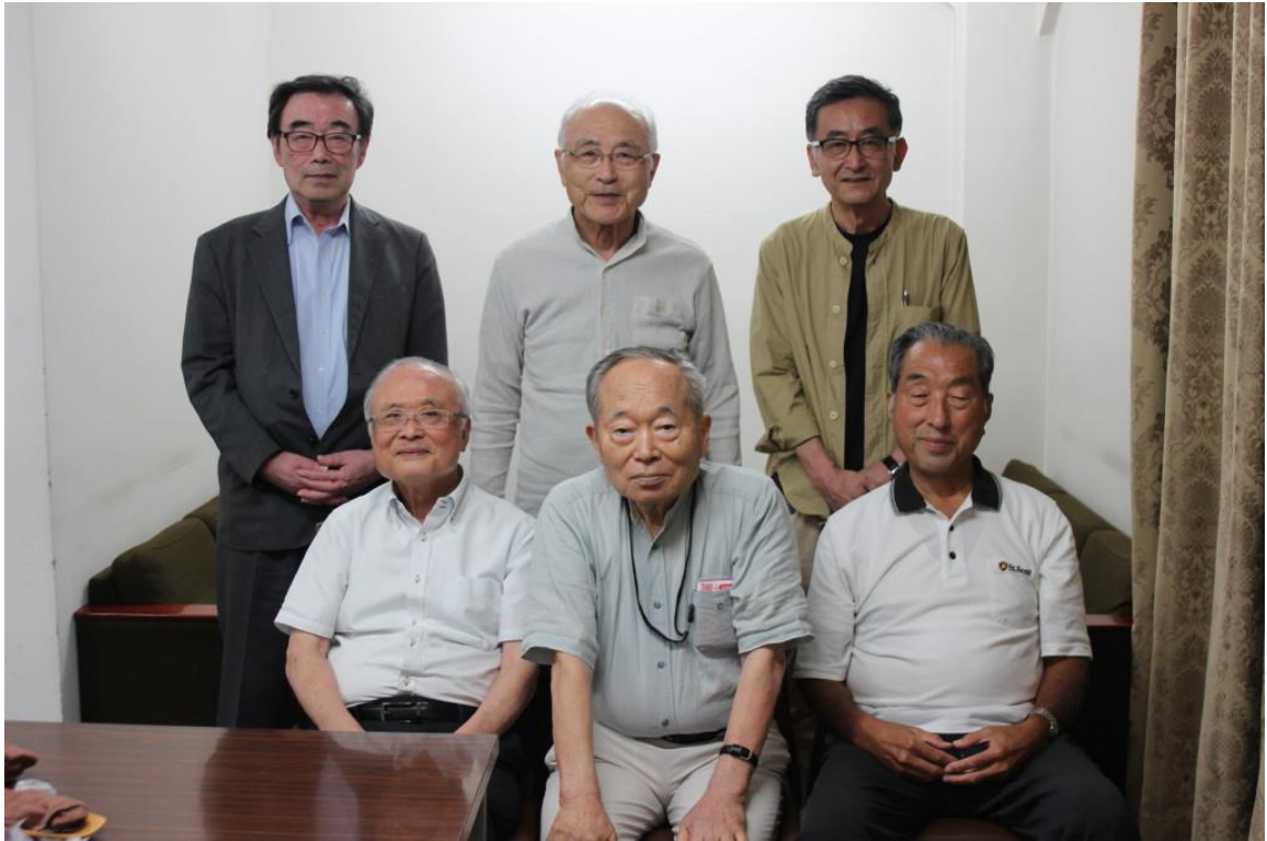
令和6年6月14日開催の月例会