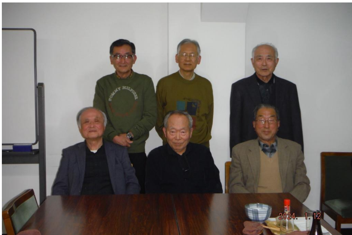
令和6年1月12日開催の月例会