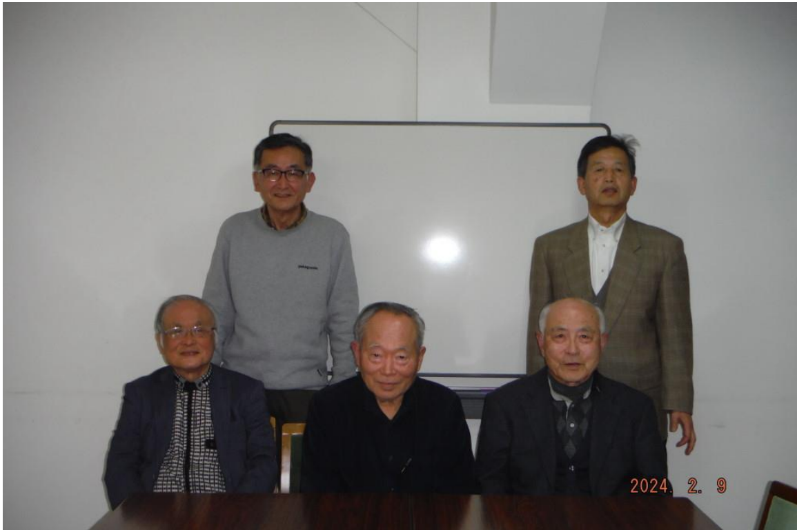
令和6年2月9日開催の月例会