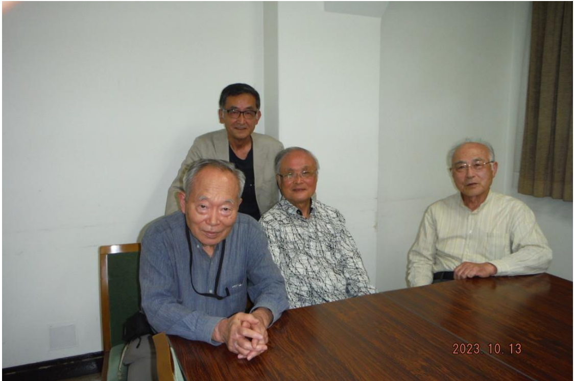
令和5年10月13日開催の月例会