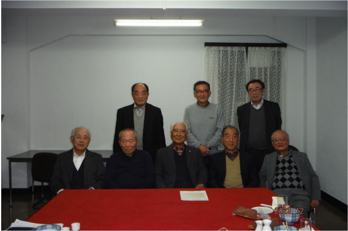
令和5年12月1日開催の月例会