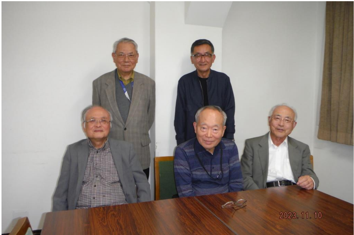
令和5年11月10日開催の月例会