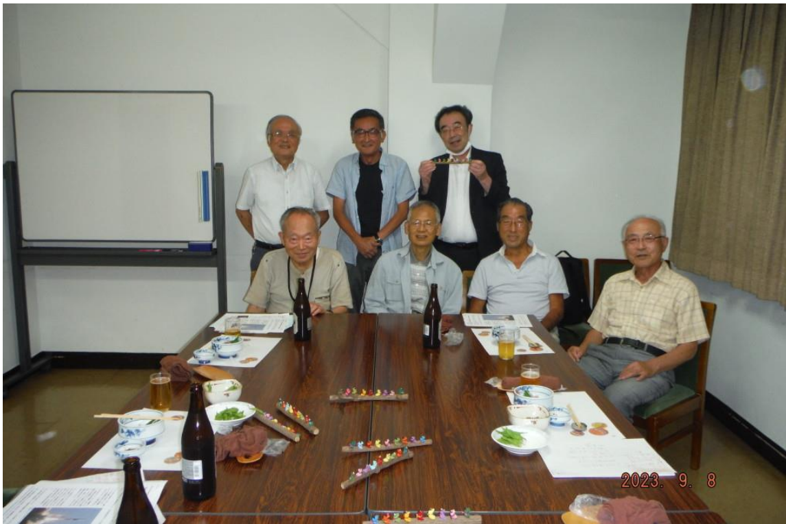
令和5年9月8日開催の月例会